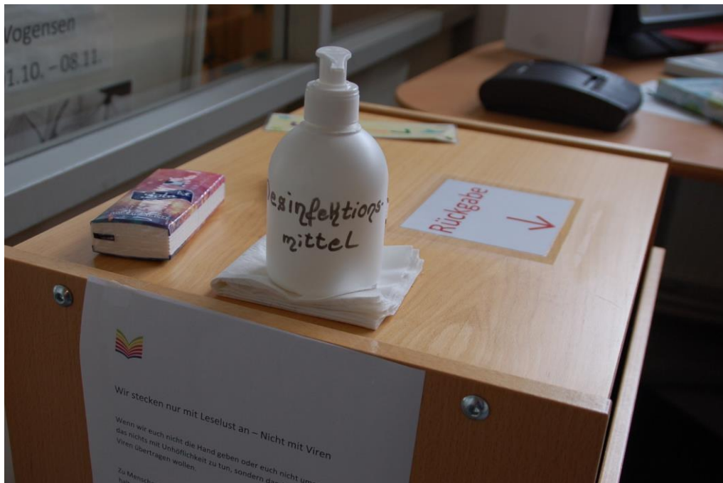
Für die Nutzer wird Desinfektionsmittel bereitgestellt.

Am Eingangsbereich wird Desinfektionsmittel für die Besucher bereitgestellt. Viel frequentierte Stellen wie Türgriffe und Selbstverbucher werden vom Personal fortwährend selbst gereinigt.