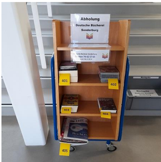
Die Abholstation im Foyer des Multikulturhauses