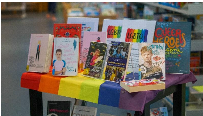
Mit Infotafeln informieren diese Bücher über alle Themen im Bereich LGBTQ+ - besonders für junge Menschen.