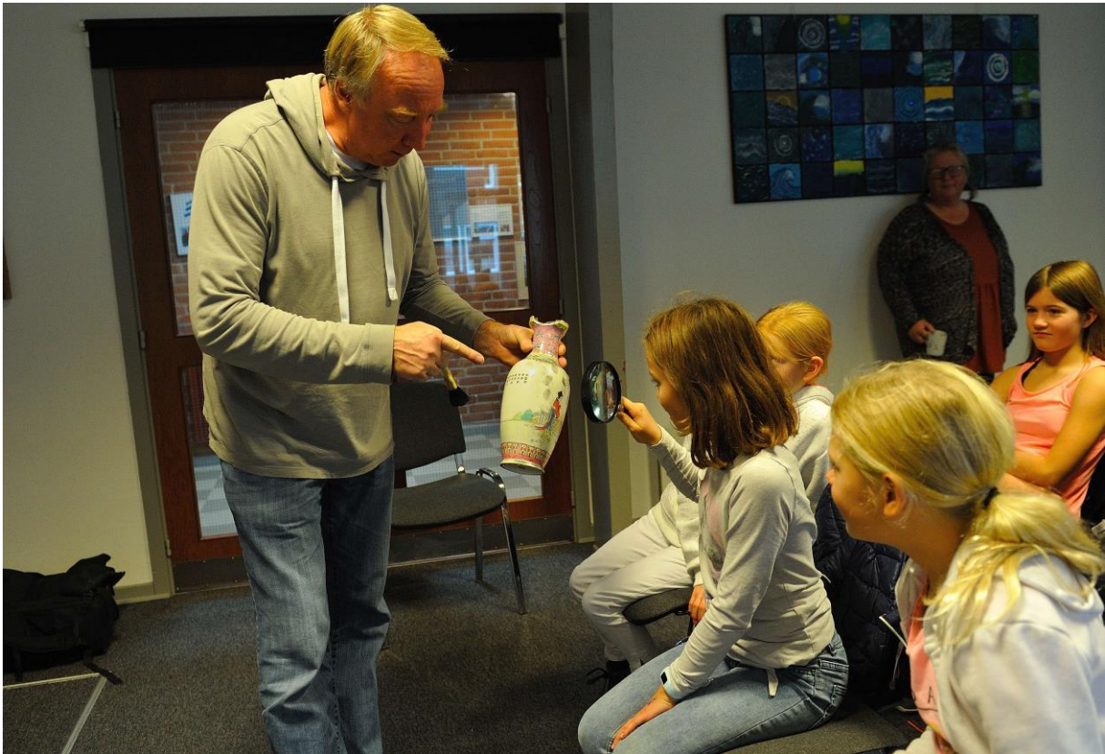
Mit dem Autor nahmen die Kinder Fingerabdrücke auf einer Vase.