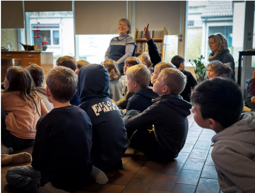
Die Kinder hatten viele Ideen und machten mit.

kleine Mitmach-Elemente eingebaut. Diesmal werden die Kinder vor allem lernen, wie sie kreativ werden und eigene Geschichten schreiben können“, erklärt er.