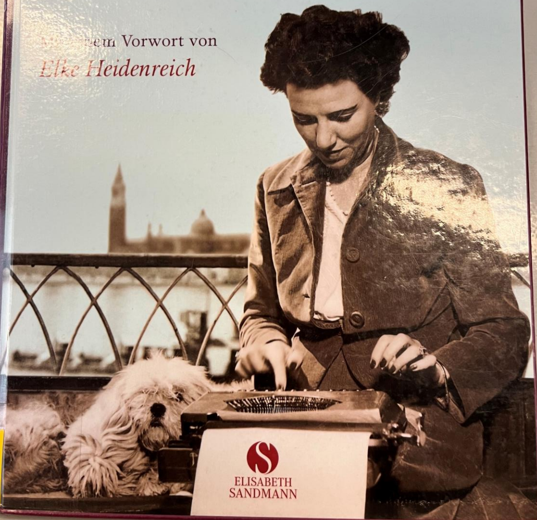
Frauen, die schreiben, leben gefährlich.