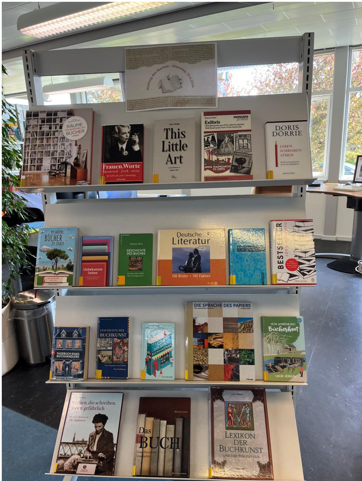
Eine kleine Ausstellung rund um das Buch in der Zentralbücherei Apenrade